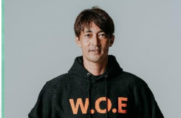
松森 亮 〔元サッカーU-20日本代表〕