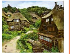
向井潤吉《山間草炎》[山形県東田川郡朝日村田妻侯] 1962年

草屋根の民家を描いた画家・向井潤吉(1901-1995)。画業における初期のハイライトといえる、若き日のフランスでの研鑽を中心にとりあげ、滞欧中の油彩画などを、後の民家を描いた作品とともに展示します。