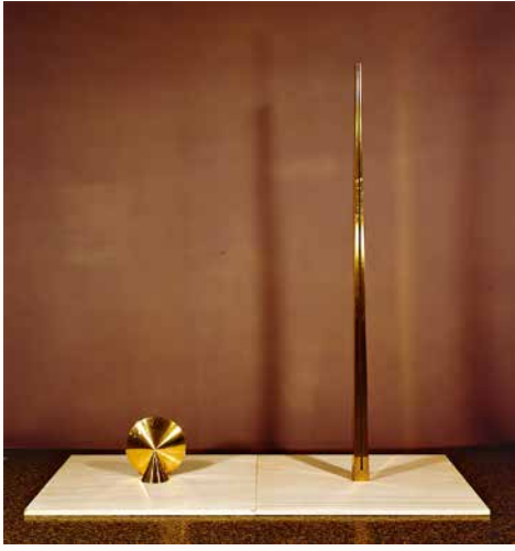
田中信太郎《Pianissimo-A》1974年 東京国立近代美術館

¥ 一般1,400(1,200)円/65歳以上1,200(1,000)円/高校・大学生800(600)円/小・中学生500(300)円