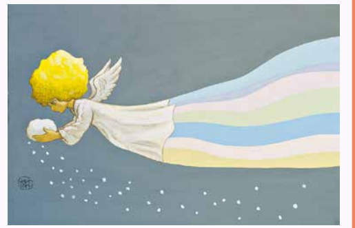
「いちごえほん」1976年2月号表紙絵「雪の天使の2月号」 ©やなせたかし (公財)やなせたかし記念アンパンマンミュージアム振興財団蔵

漫画家、詩人、絵本作家、イラストレーター、デザイナー、編集者など多彩な活動を繰り広げたやなせたかし(1919-2013)。「人を喜ばせること」が人生最大の喜びであったやなせの思いは、どのように生まれ、深められていったのか。貴重な原画約200点を中心に、「やなせたかし大解剖」「漫画」「詩」「絵本/やなせメルヘン」「アンパンマン」のテーマで作品を紐解きます。 ¥一般1,500(1,200)円/65歳以上、高校・大学生900(720)円/中学生以下無料 ※( )内は20名以上の団体料金 ※「オンラインチケット」および「当日券」を販売いたします(詳細は当館HPにて) ※中学生以下はご予約の必要はありません ※お電話でのご予約は受け付けておりません ※7月3日(金)は65歳以上観覧料無料