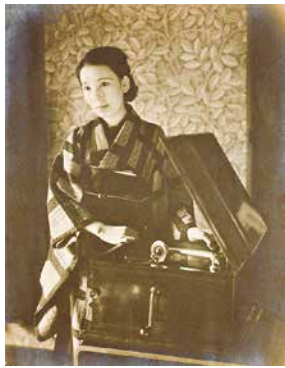
宇野千代 昭和6~7年 世田谷淡島の自宅にて

『色ざんげ』『おはん』『生きて行く私』など、数々の名作を残した作家・宇野千代(うの・ちよ 1897-1996)。 本展では、宇野の岩国での少女時代から、『おはん』の連載が始まる50歳ごろまでの資料を中心にご紹介。「色ざんげ」の自筆原稿、書簡、日記、旧蔵の着物など多彩な資料を一堂に展示します。 ¥一般220(180)円/高校・大学生170(130)円/65歳以上、小・中学生110(90)円 ※( )内は20名以上の団体料金 ※障害者割引あり ※企画展開催中は、企画展チケットの半券で、本展をご覧いただけます ※保護受給証明書をお持ちの方は無料 ★会場内では、「ムットーニコレクション」も上演中。(毎時30分上演)