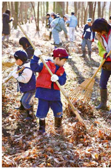
田沼武能 《雑木林の落葉掃き》 2013年1月